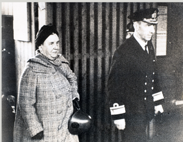
Koningin Wilhelmina vlucht naar Londen.